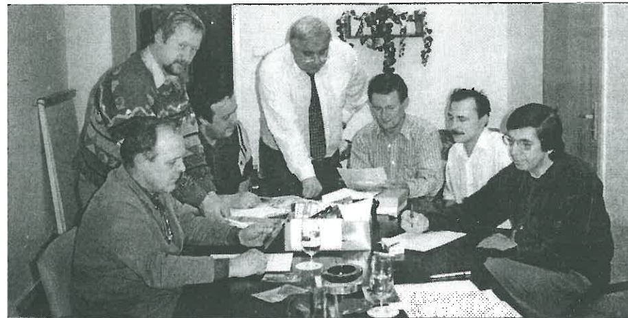
Členové redakční rady Horizontu se zamýšlejí nad připravovanou koncepcí dalšího vydávání našich novin v roce 1998.

Snad jste už také zaslechli na vlnách regionálních rozhlasových stanic (RCL, Triangl, Crystal) reklamu přesvědčující žáky posledních ročníků základních škol, aby šli studovat, případně se učili strojírenským oborům na varnsdorfskou průmyslovku nebo odborné učiliště. Tato reklamní kampaň financovaná firmou TOS je reakcí na skutečnost, že naše bývalé učiliště a SPŠ strojní v poslední době připravuje specialisty na turistický ruch, technickou administrativu, stravovací služby, ale otevřít třídu strojařů nebo obráběčů kovů se vzhledem k nezájmu dětí (i rodičů) nedaří. Přitom není tajemstvím, že jenom TOS VARNSDORF ročně potřebuje kolem 15 až 20 absolventů právě s tímto zaměřením. Proto firmě nezbývá nic jiného než zasahovat i do státních záležitostí (školsství je státní, učiliště státu firmě