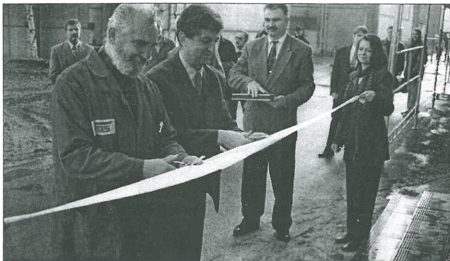
Symbolické přestřížení pásky při vstupu do roku 1998?

Také, ale hlavně snímek zachycuje slavnostní akt předávání nových centrálních šaten TOS, o nichž píšeme na 2. straně.