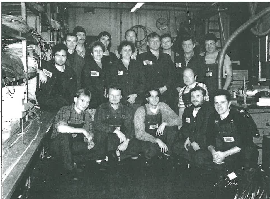
Kolektiv elektrodílny vyniká i mimopracovními aktivitami