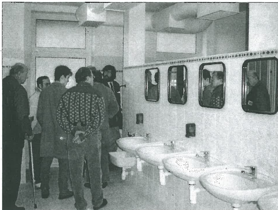
Interiér nových centrálních šaten ocenili už při jejich otevření první návštěvníci