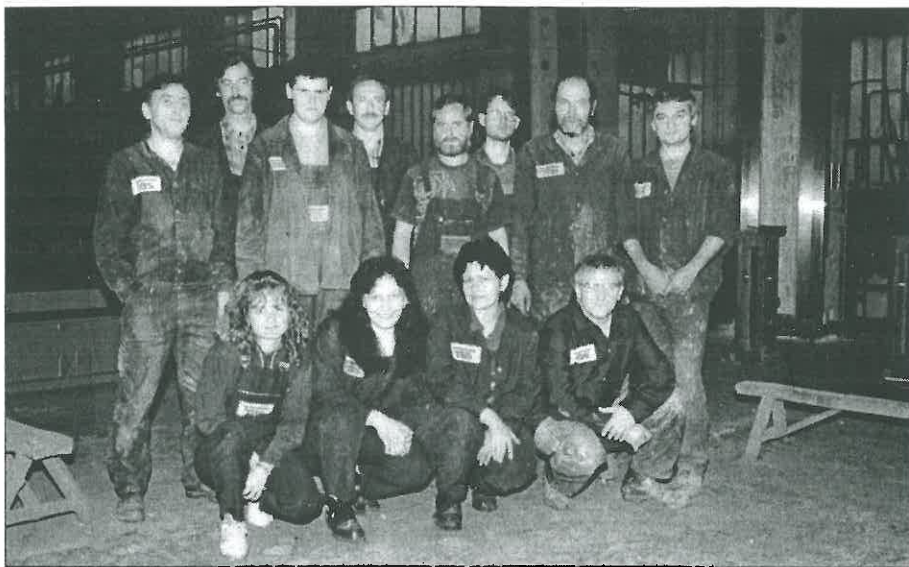
Kolektiv lakovny před objektivem.