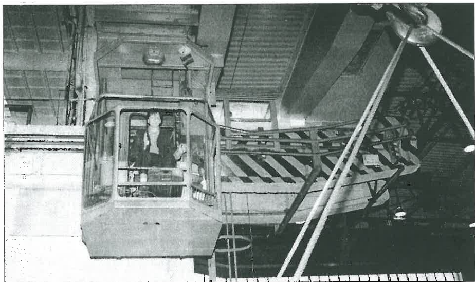
Jedna z jeřábnic zatím při své práci.

Všem uvedeným jubilantům přeje vedení a.s. hodně zdraví, osobních i pracovních úspěchů do dalších let a zároveň děkuje za jejich práci pro firmu.