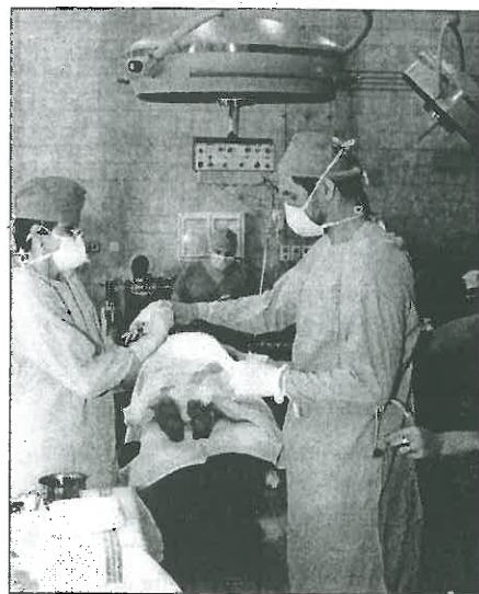
Na operačním sále varnsdorfské nemocnice se provádějí i náročné operace.

Tento náš postoj nesouvisí s našimi podnikatelskými aktivitami a má výlučně charakter podpory veřejně prospěšným aktivitám. Na doplnění chci uvést, že jen za minulý rok zakoupil TOS VARNSDORF pro zdravotnictví formou sponzorských darů zařízení v hodnotě přes 500 tisíc korun.