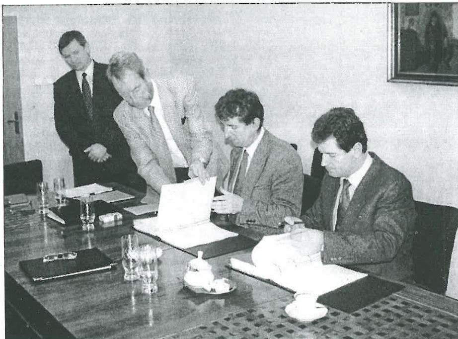
Okamžik podpisu významného kontraktu s firmou WALDRICH.