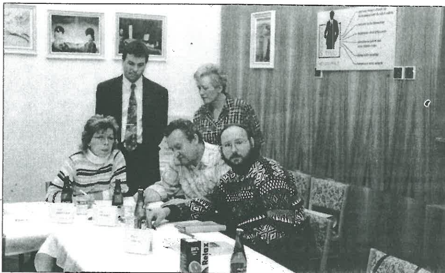
Z výcviku týmové práce.