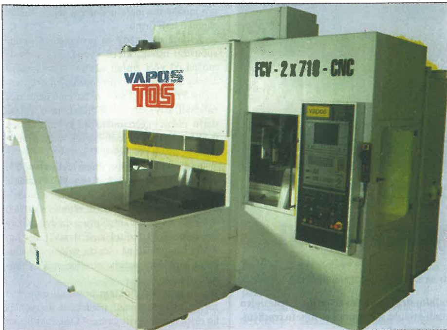
Na snímku malé obráběcí centrum - společné dílo pracovníků z VAPOS JIČÍN a TOS VARNSDORF.