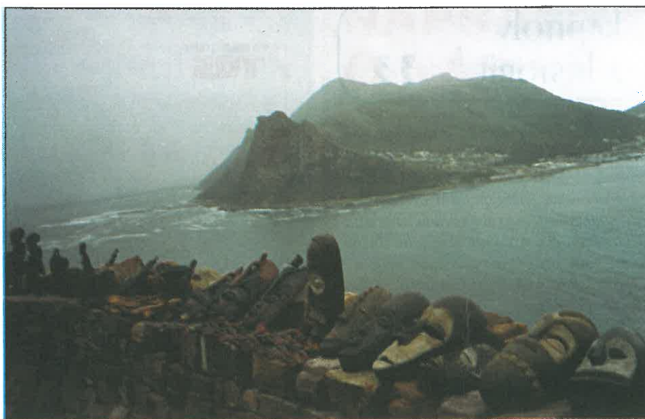
Naši cestovatelé obdivovali na úpatí Chapmanova vrcholu exotické umělecké předměty lidové tvorby.

Uvedeným jubilantům přeje vedení TOS VARNSDORF hodně zdraví, osobních i pracovních úspěchů do dalších let a zároveň děkuje za jejich dosavadní práci pro firmu.