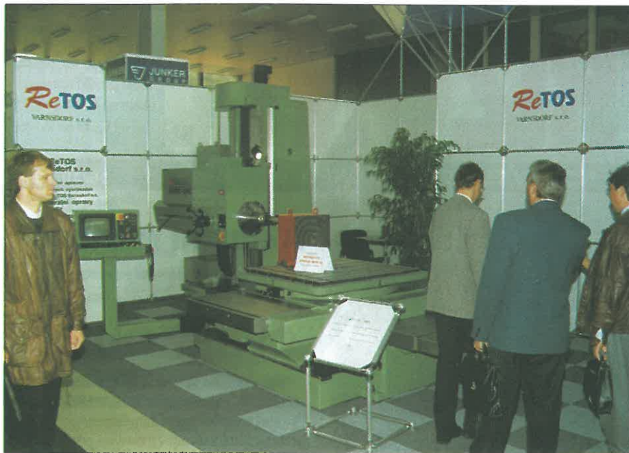
Expozice ReTOS poprvé na Mezinárodním strojírenském veletrhu v Brně.

Nakonec odcitujeme poslední věty z této besedy zveřejněné pod zajímavým názvem „Nečinite lidi šťastnými, ale úspěšnými“: „...čeká nás změna organizační struktury, aby už plně dávala prostor týmové práci a procesnímu řízení. Změna je život a důležité není jen zavádění novinek. Často těžší je zbavovat se toho, co se přežilo, a neustále se učit.“