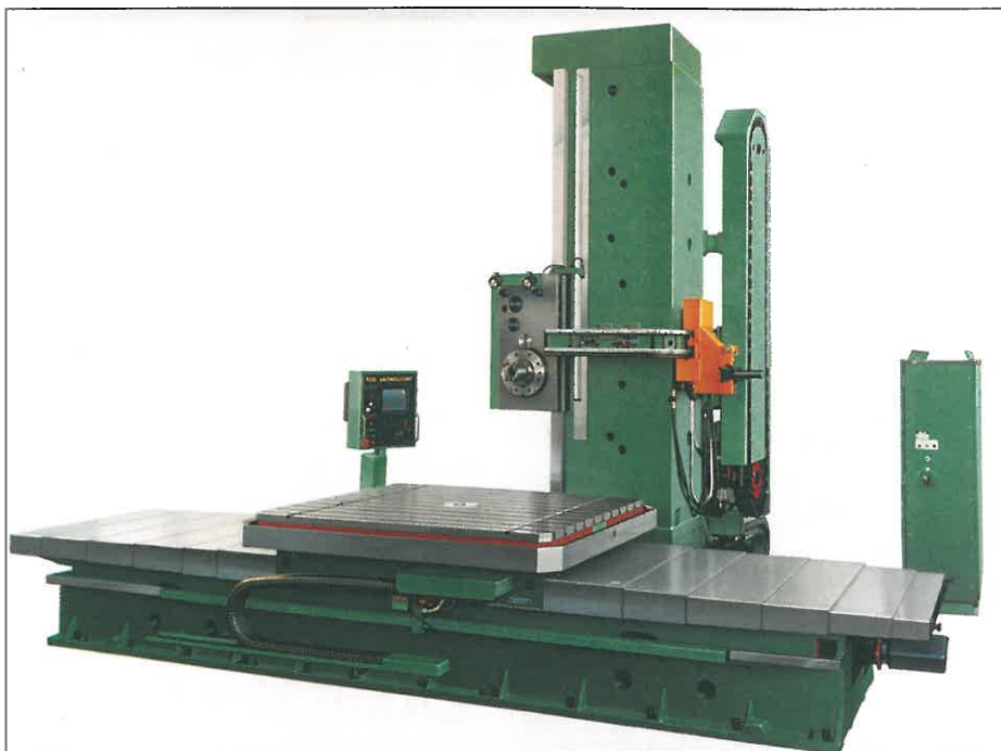
Náš stroj WHQ 13 CNC patří k nejlépe prodaným na americkém kontinentu.