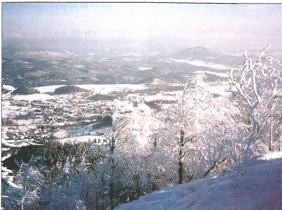
Krajina o vánocích v Lužických horách patří k nejkrásnějším.