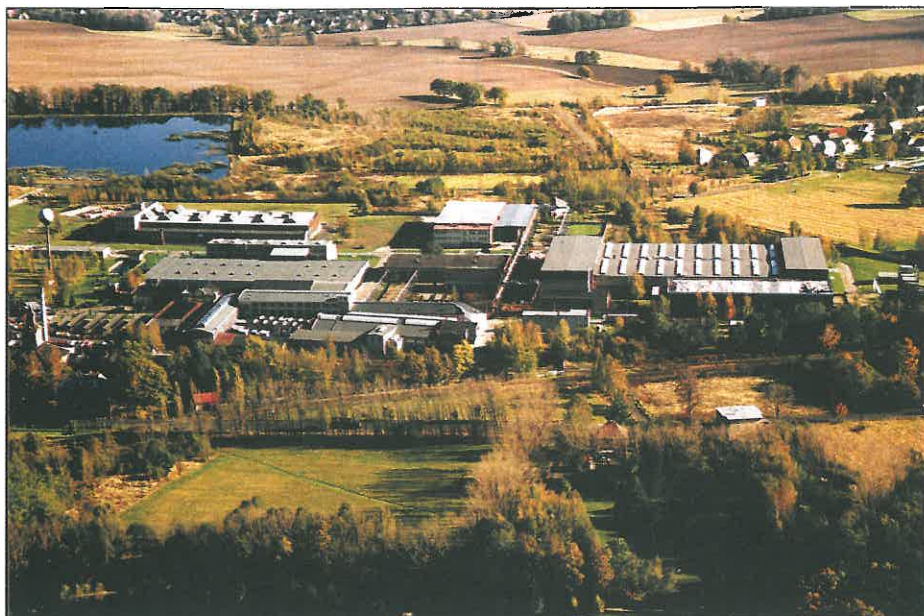
Pohled z letadla na naši firmu a okolí.

Všem uvedeným jubilantům přeje vedení TOS VARNSDORF hodně zdraví, osobních i pracovních úspěchů do dalších let a zároveň děkuje za jejich dosavadní práci pro firmu.