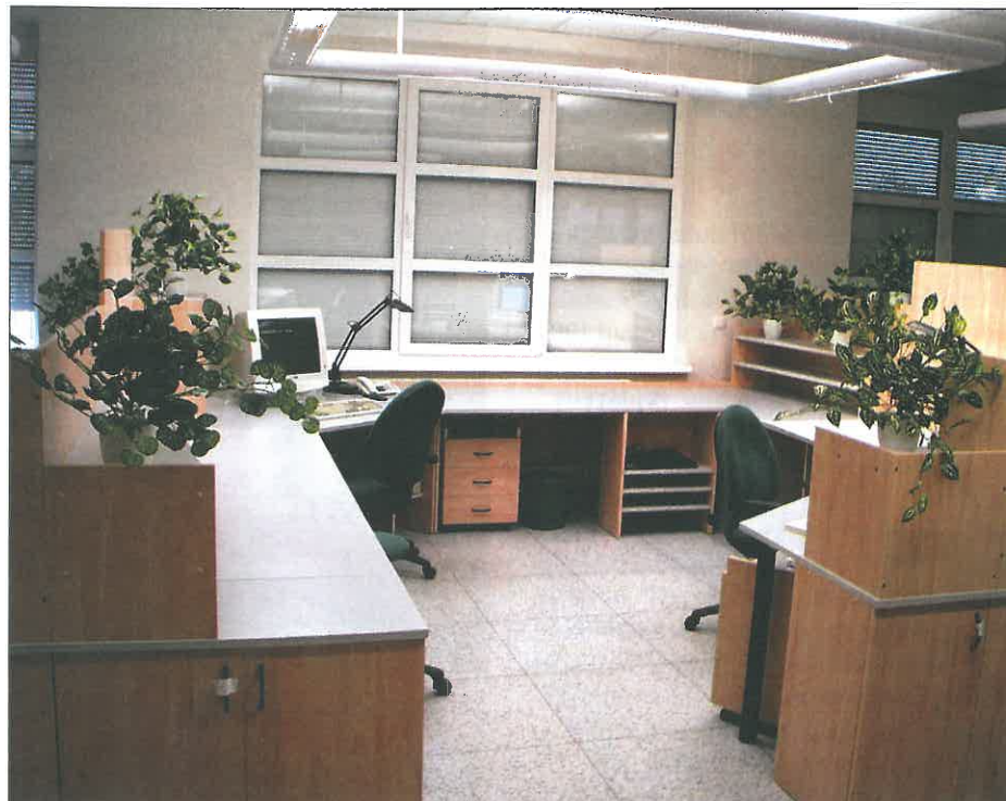
Nově vybavené kanceláře konstrukce.

Prodej kaprů se uskuteční ve dnech 21. prosince od 8 do 18 hodin a následující den 22. prosince od 7 do 12 hodin v prostorách garáží Velveta, a. s., pod vlakovým nádražím.