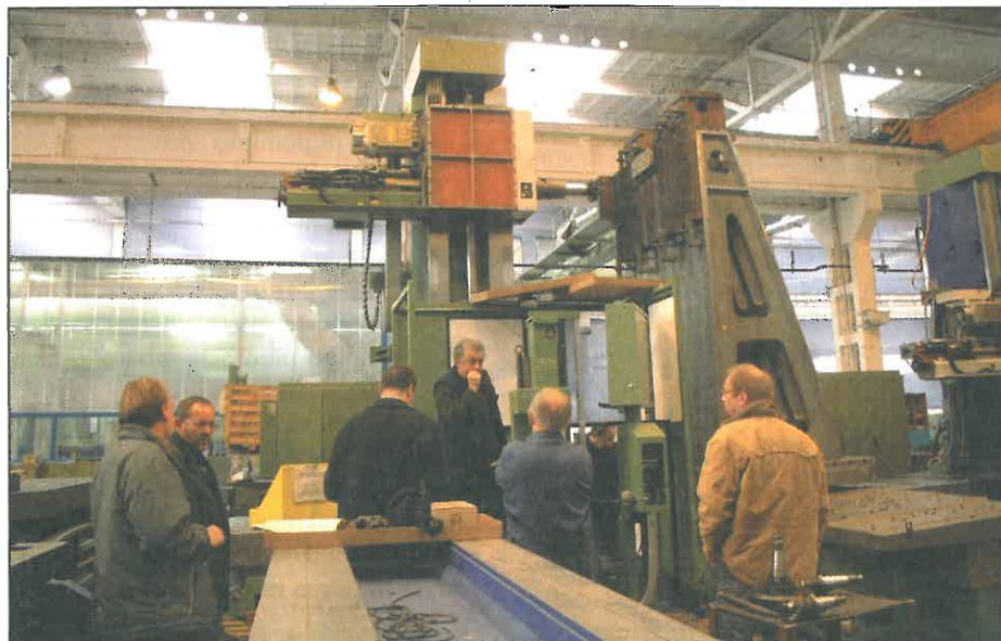
V pátek 13.12.2002 proběhlo v TOS VARNSDORF a.s. předvádění obrábění pro německou firmu Schottel na nám všem známé třináctce s třímetrovou ypsilonkou. Zákazník byl s výsledky zkoušek spokojen a dal si krátký termín na rozhodnutí, zda si stroj v této konfiguraci objedná.