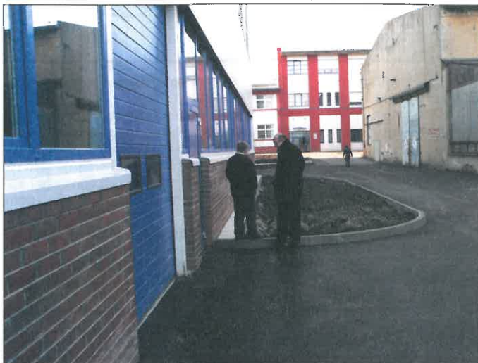
Malej a velkej. Čekání na hosta.