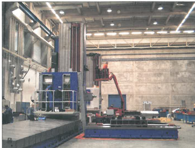
Ve které se již pracuje.