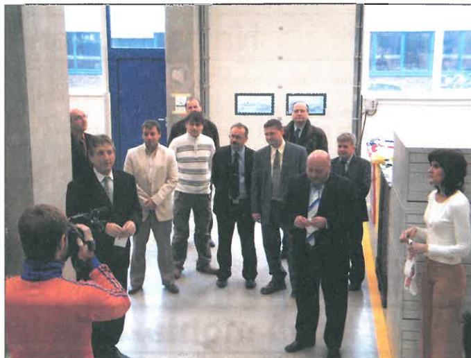
Bylo stříženo, nyní krátký proslov. Ten kameraman je z GENUS TV.