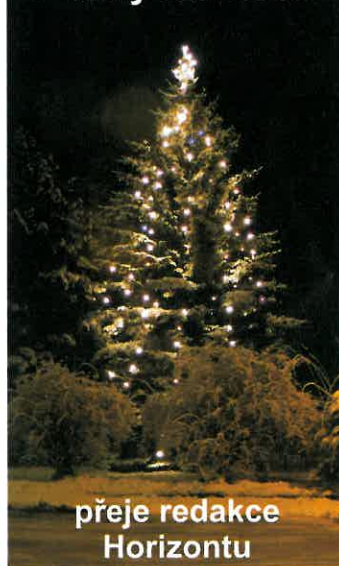
přeje redakce Horizontu