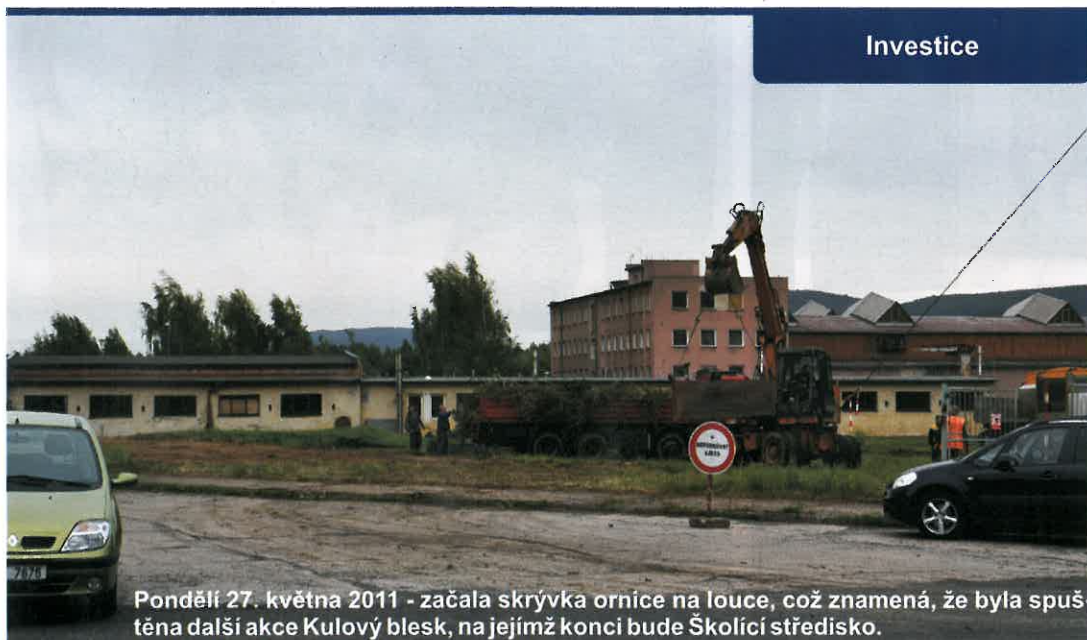
Pondělí 27. května 2011 - začala skrývka ornice na louce, což znamená, že byla spuštěna další akce Kulový blesk, na jejímž konci bude Školící středisko.

HORIZONT, firemní noviny, vydává pravidelně TOS VARNSDORF a. s., IČO 27327850.